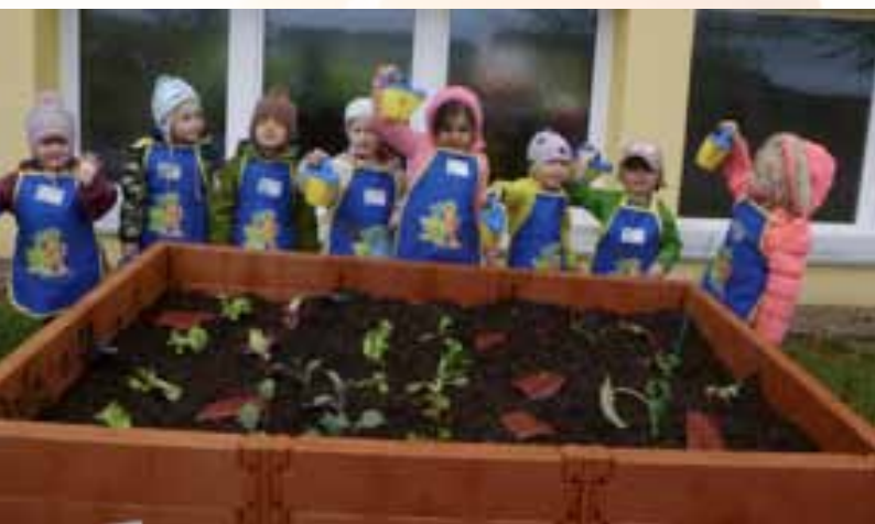
Die Gemüsebeete des kath. Kindergarten Don Bosco